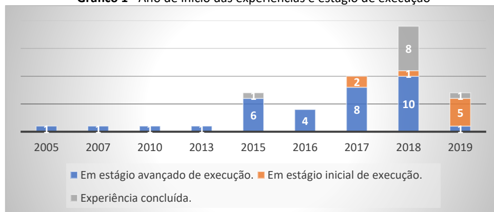
Gráfico 1 - Ano de início das experiências e estágio de execução

Nota: Uma experiência foi retirada do gráfico visto apresenta a data de início em 1905